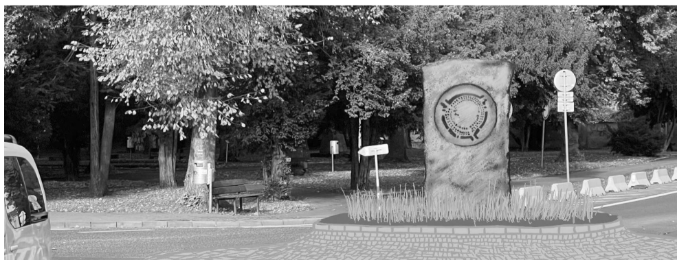
Horní dvě varianty jsou z kovu a budou pravděpodobně lépe realizovatelné a finančně méně náročné, než spodní dva návrhy, kde je hlavním nosným médiem pískovec - typická místní hornina.