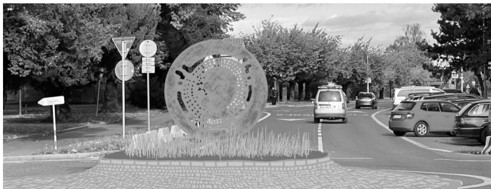
Návrhy vycházejí z půdorysu RONDELU, který zde byl objeven již roku 1981 a následně odkryt roku 2020. Jeho pozůstatky naleznete kousek od ulice Českodubské. Zatím jsou volně přístupné.