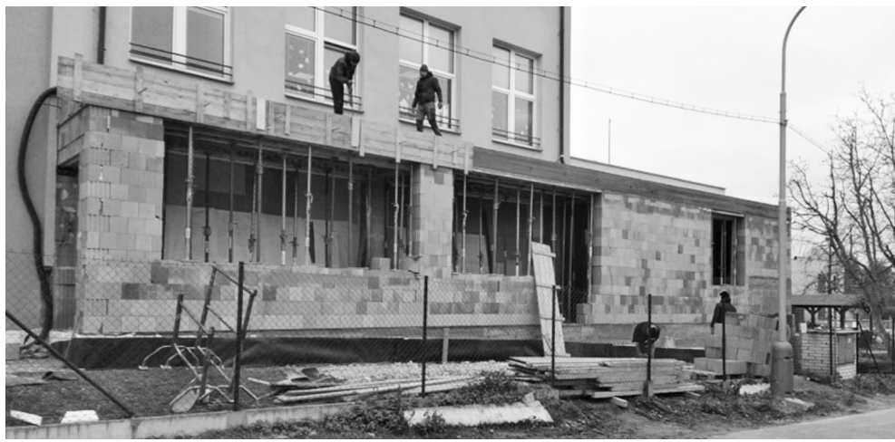
Pokračující dostavba školní jídelny