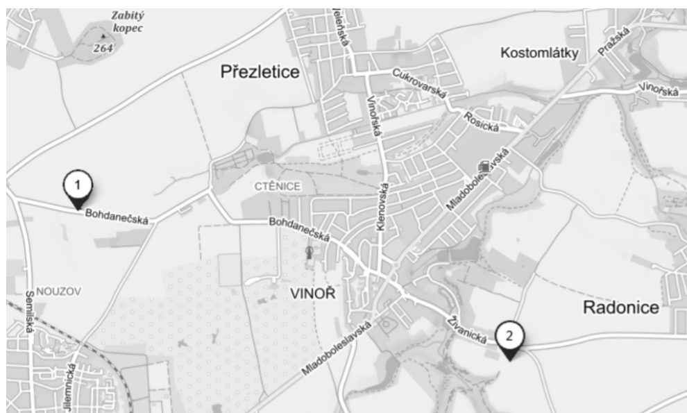
Mapa rozmístění stromů, č. 1 šedesát kusů jabloní, č. 2 čtyřicet kusů hrušní

Ing. Jana Vaculová, referent veřejné zeleně