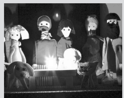
Foto z představení Vánoční příběh

Na divadelní představení je nutná rezervace. Prosíme, abyste si volné vstupenky vyzvedli v knihovně. Úterý a čtvrtek 9:00–13:30 a 14:30–19:00