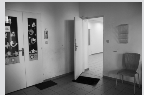
Vchod do prostorů hned vedle družiny ZŠ