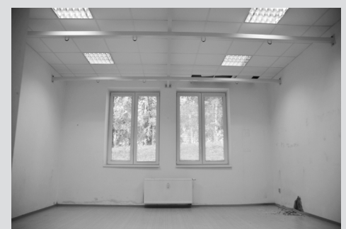
Pohled do jednoho ze dvou sálů. Po odstranění příčky bude k dispozici jeden větší sál