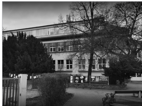
Budova ZŠ Praha-Vinoř