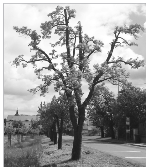
Hrušně v Bohdanečské po úpravě