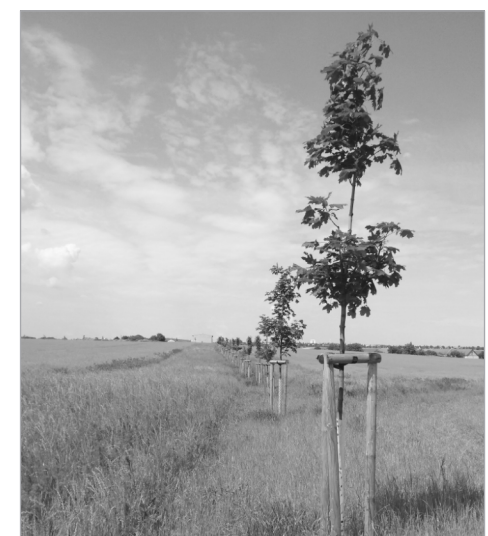
Výchovný řez mladých stromů ve Ctěnicích