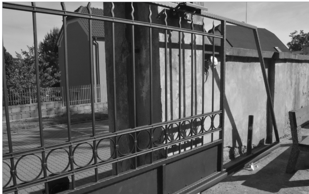
Nová, elektricky poháněná, vrata na hřbitov