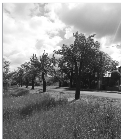
Hrušně v Bohdanečské před úpravou