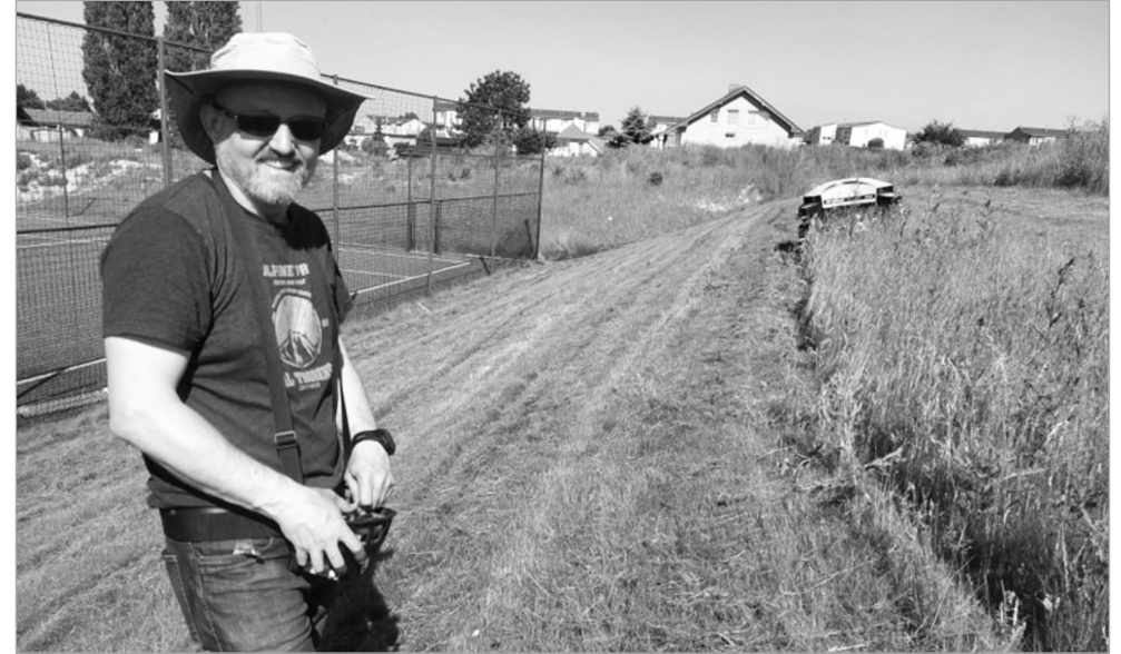
„Nový“ technický pracovník. Děkujeme!