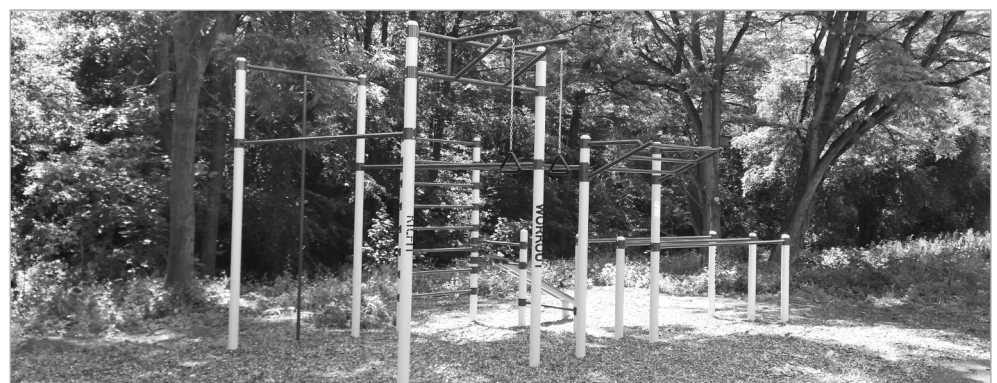
Nový workout pro cvičení v přírodě