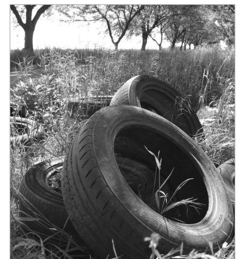
Pneumatiky můžete vrátit ve Kbelích