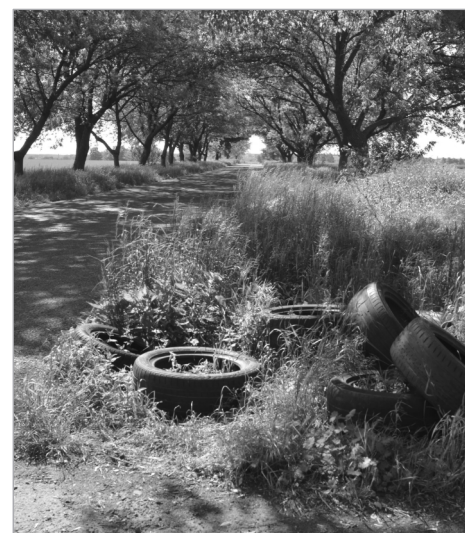
Černá skládka ve směru na Horní Počernice