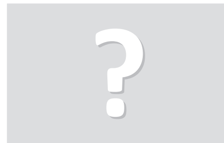
Zveřejníme v příštím vydání