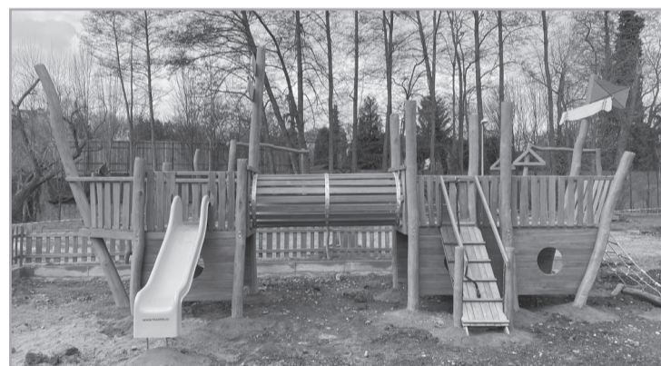
Hřiště V Podskalí