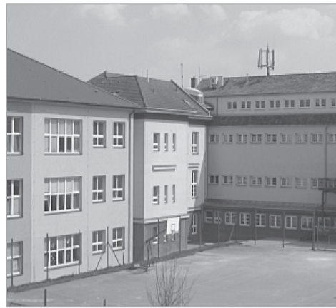
ZŠ Praha-Vinoř, Prachovická ul.

Po ukončení mimořádných opatření proběhne schůzka rodičů nově přijatých dětí, kde budete informováni o organizaci vstupu dítěte do MŠ – sledujte webové stránky. Pokud se schůzka nebude moci uskutečnit, pokyny k zahájení docházky dítěte do MŠ, včetně rozdělení dětí do tříd, naleznete zde. Svůj souhlas se zveřejněním jména dítěte při rozdělení do tříd dáváte v žádosti o přijetí. Evidenční list dítěte, již potvrzený