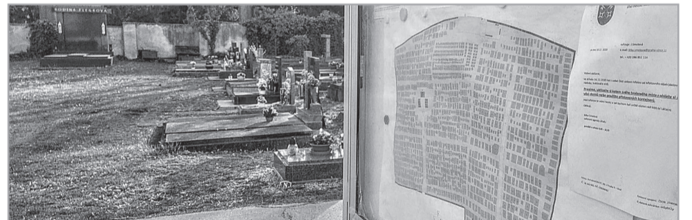
Rozložení hrobových míst a jejich označení, plánek ve vývěsce na hřbitově