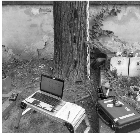
Tahová zkouška u borovice na hřbitově