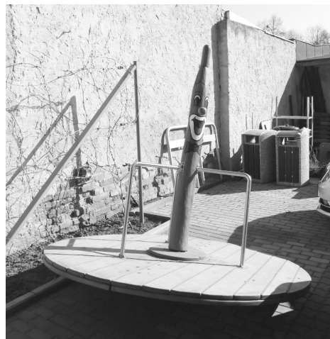
Poškozený hrací prvek ze hřiště u školy