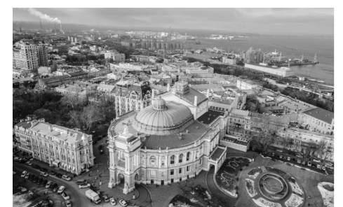
Akademické divadlo opery a baletu