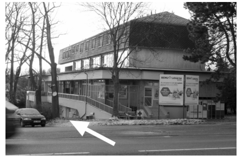
Telocvična VINCENT, Mladoboleslavská 514

V ceně je zahrnuto: drobné občerstvení, materiál na výrobu náramku, aromaterapeutický zábal na obličej nebo ruce na závěrečnou relaxaci. Cena za osobu 900 Kč při rezervaci do 2. 4. 2022, při rezervaci dvou osob najednou 1 700 Kč. Později je cena 1 000 Kč a při rezervaci dvou osob najednou 1 900 Kč. Rezervace na email: marketa.obrova@gmail.com V případě zájmu možno zaslat i dárkový poukaz.