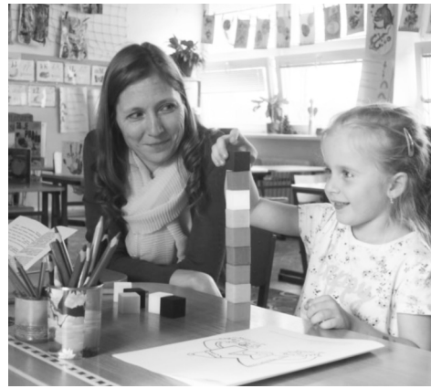
Zápis do 1. třídy (ilustrační foto)

Všem uchazečům držíme palce, ať se přijímačky povedou.