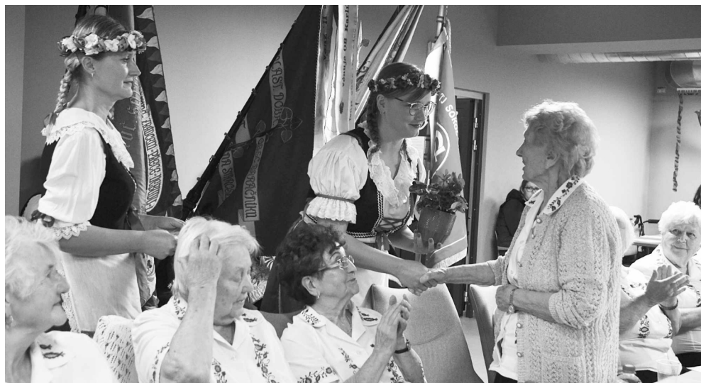
Předávání poděkování za dlouholeté zásluhy (oslavy 90 let O. B. J. A. Komenského ve Vnoři)