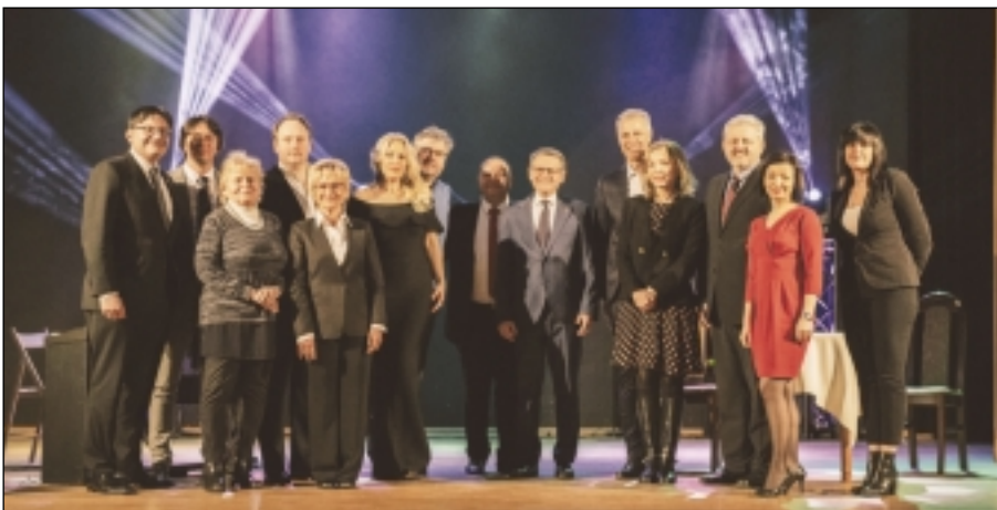
Delegace z Prahy-Vinoře spolu s umělci a přáteli z Polska a Německa po skončení koncertu v Městském centru kultury