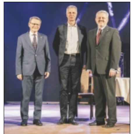
Starostové Kargowé, Schulzendorfu a Vinoře pohromadě...