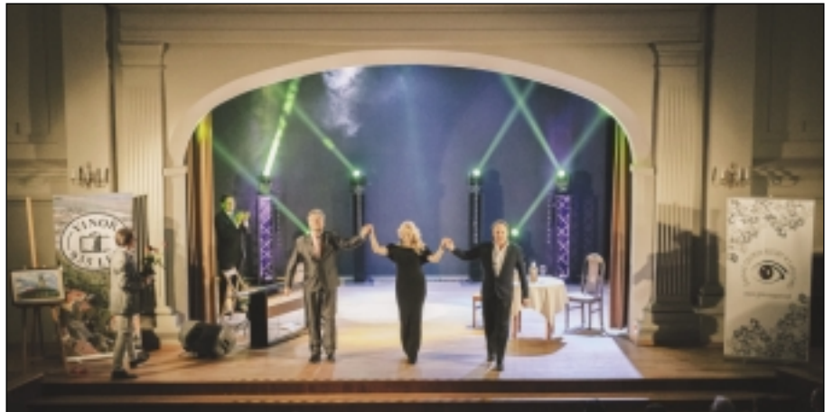
Závěrečný aplaus po skončení koncertu v Kargowé