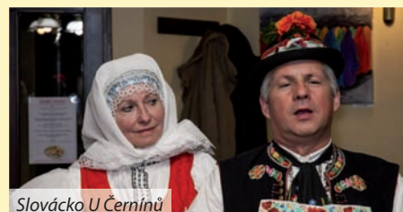
Slovácko U Černínů

Restaurace U Černínů se díky bratrské spolupráci s Hoffmanovým dvorem stává klidnějším místem. Vernisáže, Černínské košty, koncerty, jakým byl i Oskar Petr Trio. Komornější akce převládají a zůstává také větší prostor pro samotnou gastronomii. Každý víkend, po celý rok, vám nabízíme speciální nabídku menu. Po každé vás překvapí něco jiného, než byste v restauraci se zaměřením na italskou kuchyni, čekali. Nabídka postavená na národních kuchyních či jen na určitých surovinách nebo připravená pro hody v českých