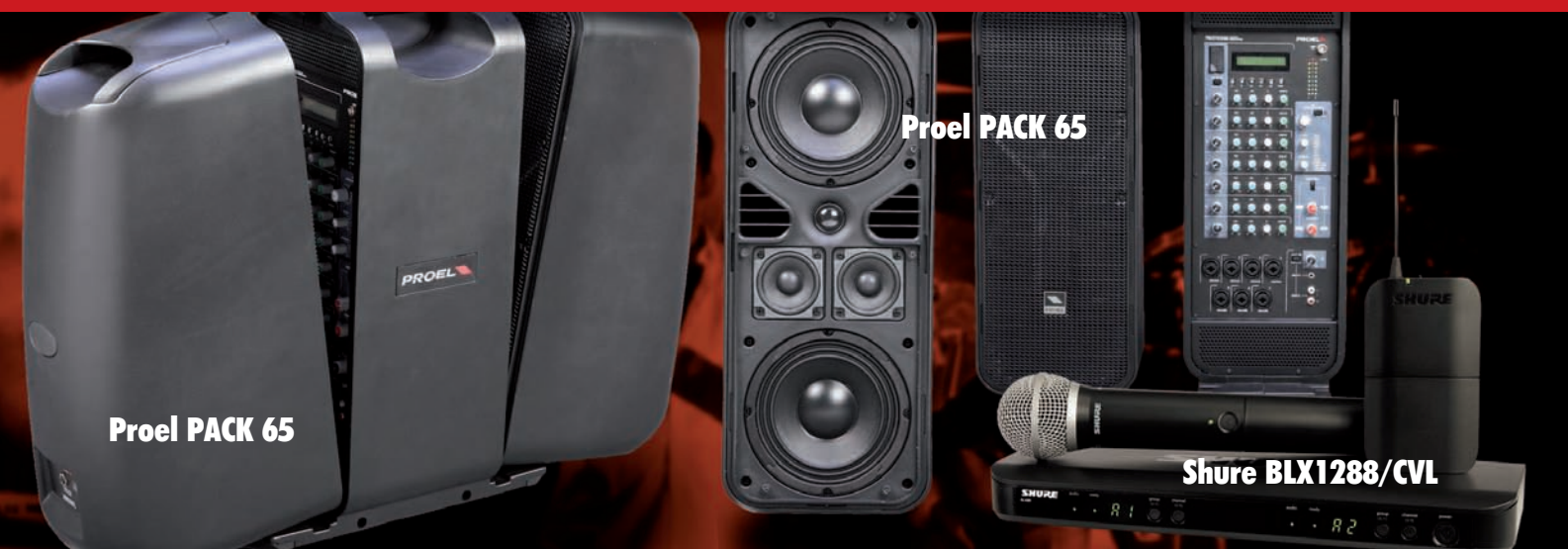
Proel PACK 65