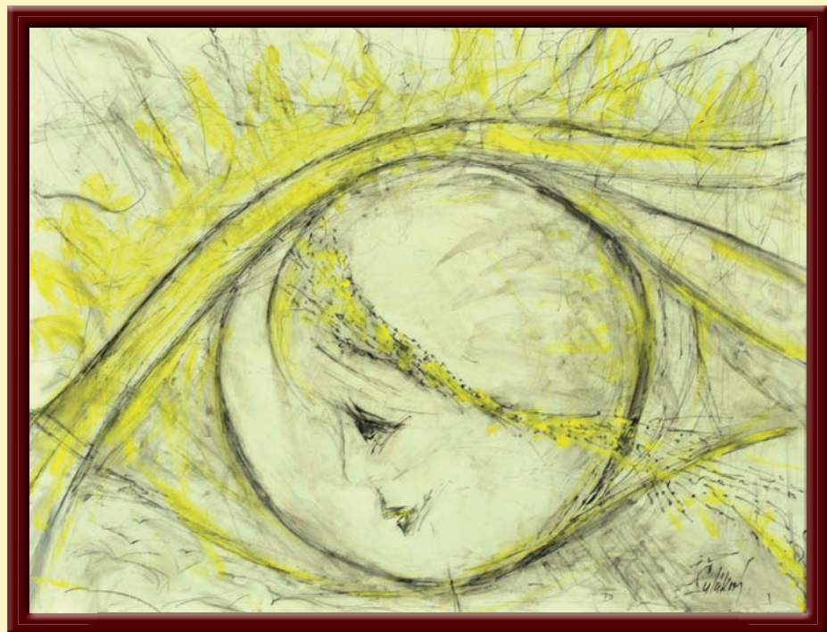
Něžná křehkost 2015